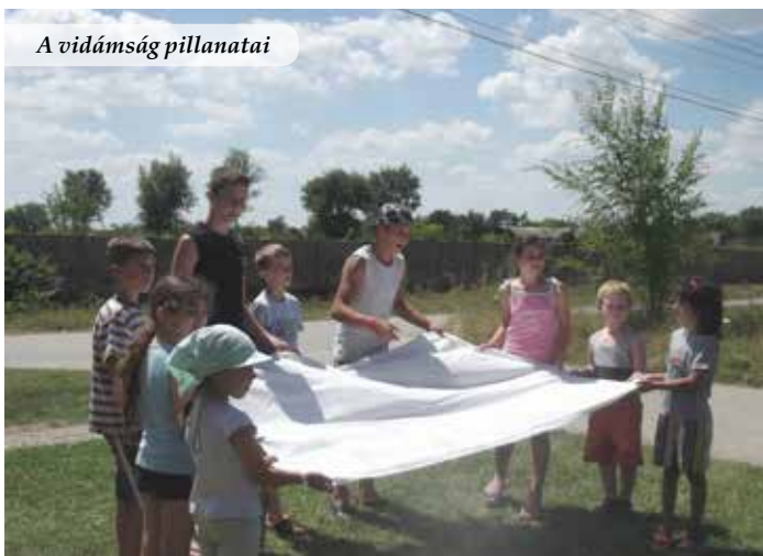
A vidámság pillanatai