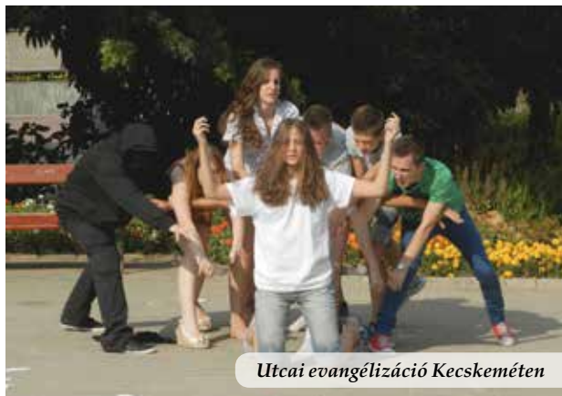
Utcai evangélizáció Kecskeméten

Ifjúsági táborunk idén renghagyó volt, mert