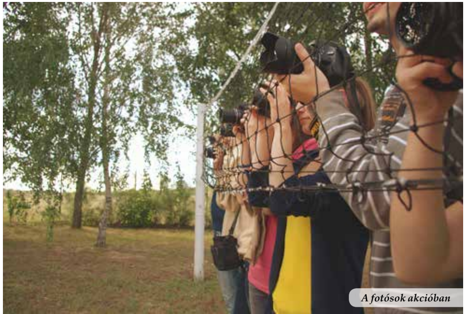
A fotósok akcióiban