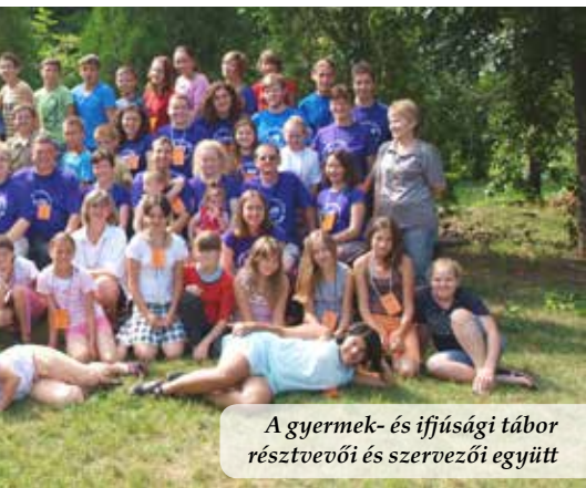
A gyermek- és ifjúsági tábor résztvevői és szervezői együtt