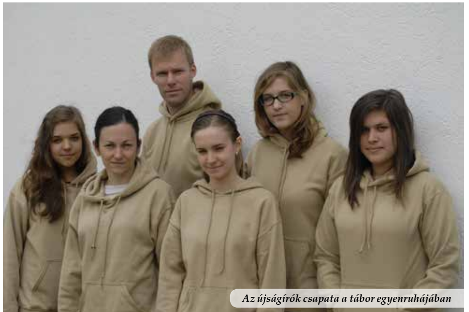
Az újságírók csapata a tábor egyenruhájában