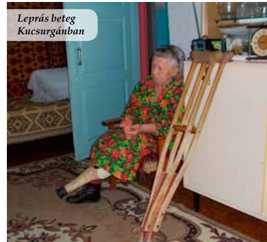
Leprás beteg Kucsurgánban