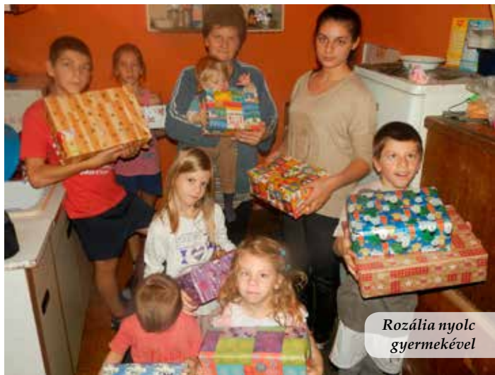
Rozália nyolc gyermekével

Más nehézségekkel küzdenek az erdélyi Szakas nevű falu egyik árvaházában lakó gyermekek. Az intézményt családi típusú otthonnak nevezik, melyben jelenleg tizenhárom gyermek lakik. Ennek ellenére az intézmény otthont nem, csak a fizikai védelmet biztosítja számukra. Ahogy helyi munkatársunk fogalmazott, „hiába van jó meleg, és készül palacsinta a paszulyleves után, a nevelők egyike sem szereti anyai szeretettel a gyerekeket”. Szeretetre pedig nagy szükségük van. Így aztán a cipősdobozok kiosztása mellett sok szó esett Isten kegyelméről, a karácsony lényegéről, Jézus gondoskodó szeretetéről, melynek