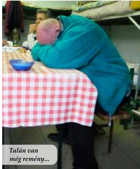
Talán van még remény...

ítási folyamatba csöppentünk bele. Az épületkomplexumban összesen hatvan hajléktalan kaphat kényelmes fekhelyet. A misszió vezetői semmiféle etnikai, vallási vagy más különbséget nem tesznek a jelentkezők között, hanem mindenkit szívesen látnak, „aki nem balhész”.