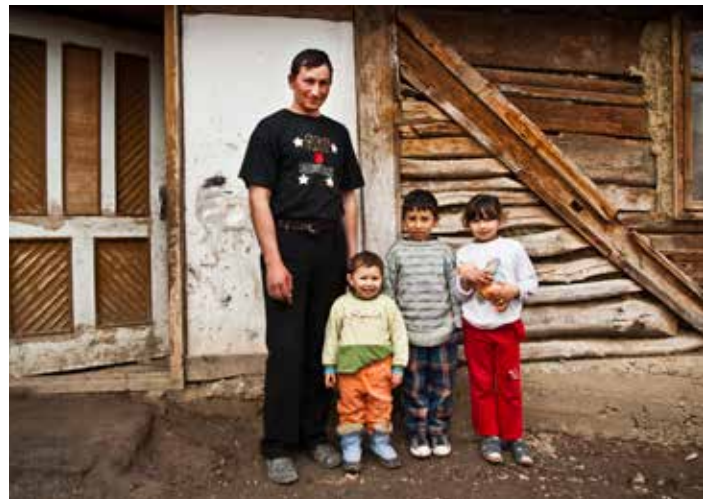
Megérkezett az új kályha