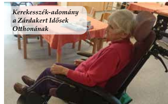
Kerekesszék-adomány a Zárdakert Idősek Otthonának

gyűjtő zsákokból, hólyagkatéterekből, kötszerekből, rugalmas pólyákból, fecskendőkből és maszkokból álló segélyadományt adtunk. A csepeli Olajág Otthonok öt speciális kórházi ágyat, kötszert, inkontinenciás pelenkát és felfekvés elleni, felfújható matracokat kapott. Az otthonon belül egy új részleget hozat létre olyan demens idős betegek részére, akik fokozott gondozást igényelnek. A megnyitáshoz szükséges felszerelés viszont hiányos volt, ezért fordultunk hozzánk segítségért. 2015. július 13-án az új részleg megnyitásán mi is részt vettünk.