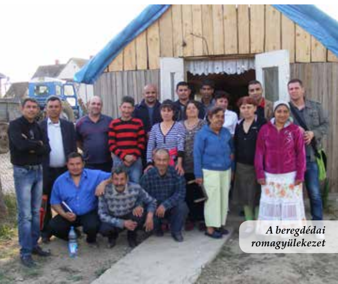
A beregdéai romagyülekezet