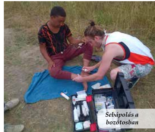
Sebápolás a bozótosban

A menekültek zöme muzulmán, nagyon ritkán