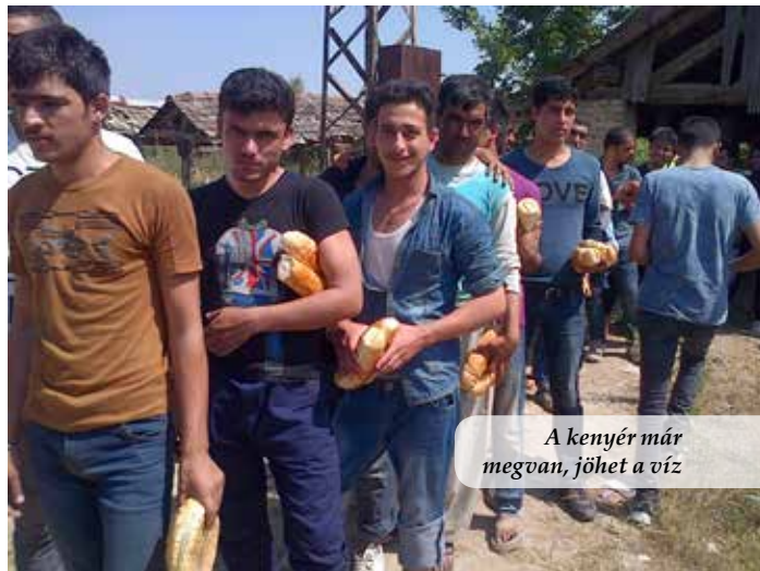
A kenyér már megvan, jöhet a víz

Imádkozunk azért, hogy az európai keresztények kihívásként kezeljék a menekült kérdést; hogy meglássák a nyitott ajtót, amit Isten elénk tárt az evangélium hirdetésére a muzulmánok között.