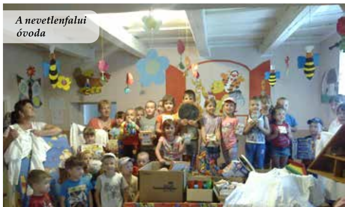
A nevetlenfalui óvoda