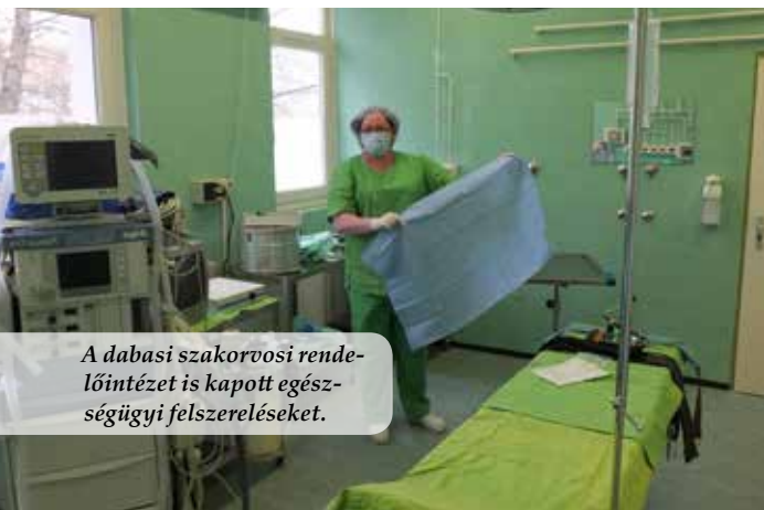
A dabasi szakorvosi rendelőintézet is kapott egészségügyi felszereléseket.

A Kelet-Európa Misszió a nyár folyamán négy intézménynek is jelentős mennyiségű segélyadományt adott át, mely orvosi segédeszközöket és egészségügyi felszereléseket tartalmazott.