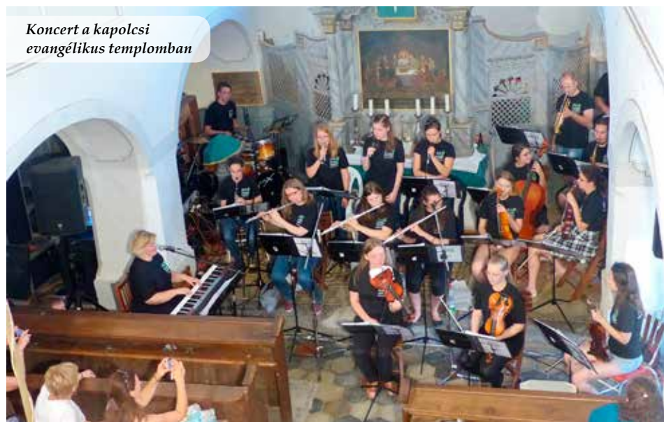
Koncert a kapolcsi evangélikus templomban