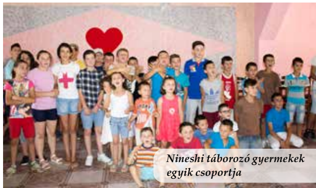
Nineshi táborozó gyermekek egyik csoportja

Istenről, de az egyik srác, aki a hét végén megtért, azt mondta: „Ti olyan mások vagytok, én is szeretném azt, ami nektek van.” Az utolsó ott töltött napon a gyerekek közül is sokan befogadták Jézust a szívükbe. Hiszem, hogy egyre növekszik ezen a helyen Isten munkája, és a kilátástalanság helyére remény jön az emberek életébe.